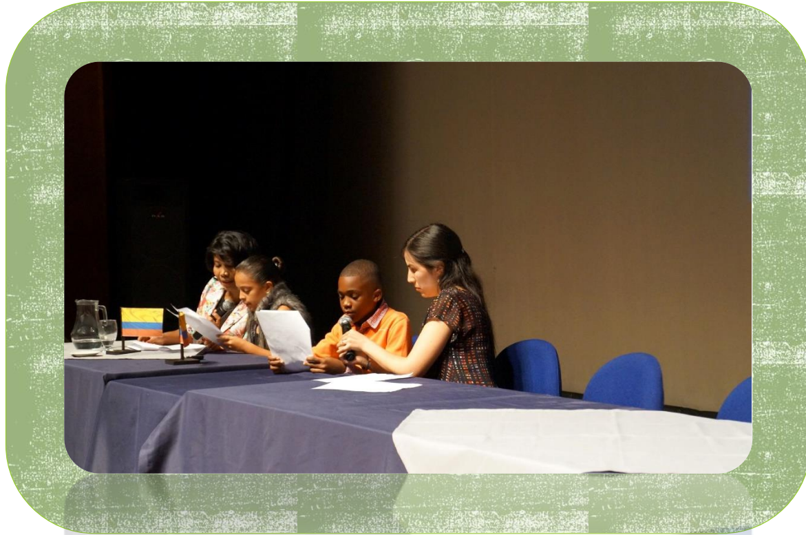
Participación de niños CNOA en Presentación del Pronunciamento Final